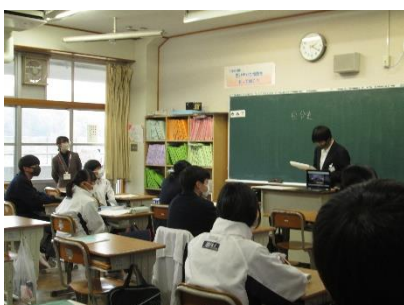
【1-1 総合的な学習の時間】

2月10日（金）5時間目に授業参観、6時間目に学級懇談会を行いました。今年度最後の参観授業ということで生徒たちの1年分の成長を見て頂くことができました。1年生は自分史作成に関わって自分の未来に関する発表、2年生・3年生に関しては担任の先生以外の授業でしたが、それぞれ一生懸命取り組む姿が見られました。またその後の学級懇談会では保護者様からも多くの意見を頂き、実りある会になりました。次年度に向けてますます頑張っていきたいと思えます。お忙しい中多くのご参加をありがとうございました。